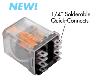
Plain Cover Option C