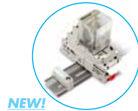
389 Relay with the 70-788EL11-1 Socket