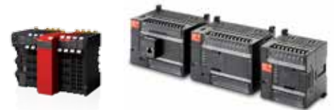
NX-S Sysmac Safety System