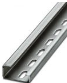
G-profile DIN rail, material: Steel, perforated, height 15 mm, width 32 mm, length 2 m

Please be informed that the data shown in this PDF Document is generated from our Online Catalog. Please find the complete data in the user's documentation. Our General Terms of Use for Downloads are valid ( http://download.phoenixcontact.com )