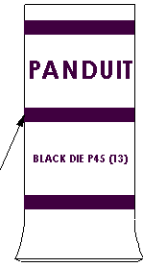
Color coded barrel markings