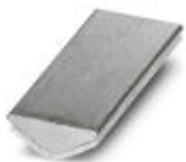
Insertion profile, Color: silver