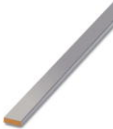
PEN conductor busbar, 3mm x 10 mm, length: 1000 mm

Please be informed that the data shown in this PDF Document is generated from our Online Catalog. Please find the complete data in the user's documentation. Our General Terms of Use for Downloads are valid ( http://download.phoenixcontact.com )