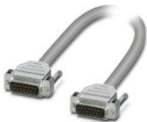
Assembled, shielded round cable, with two 15-pos. D-SUB pin strips (1:1 connection), cable length: 7.20 m

Please be informed that the data shown in this PDF Document is generated from our Online Catalog. Please find the complete data in the user's documentation. Our General Terms of Use for Downloads are valid ( http://phoenixcontact.com/download )