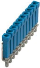
Jumper, Number of positions: 10, Color: blue

Please be informed that the data shown in this PDF Document is generated from our Online Catalog. Please find the complete data in the user's documentation. Our General Terms of Use for Downloads are valid ( http://download.phoenixcontact.com )