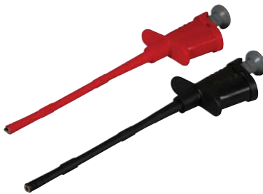
CT2489 (see model numbers above)

Copyright © 2007, Cal Test Electronics, Inc. All rights reserved. Information in this publication supersedes that in all previously published material. Trade names referenced are the service marks, trademarks or registered trademarks of their respective companies.