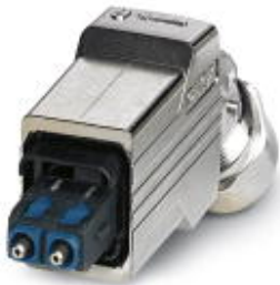
Push-pull connector (version 14), die-cast zinc, with SC-RJ insert for POF, for cable diameter of 5.5 mm ... 10 mm, cable outlet at the bottom

Please be informed that the data shown in this PDF Document is generated from our Online Catalog. Please find the complete data in the user's documentation. Our General Terms of Use for Downloads are valid ( http://phoenixcontact.com/download )