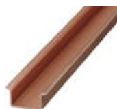
DIN rail, material: Copper, unperforated, 1.5 mm thick, height 15 mm, width 35 mm, length: 2 m

DIN rail - NS 35/15 CU UNPERF 2000MM - 1201895