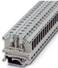
Universal terminal block with bolt connection, cross section: 0.1 - 2.5 mm 2 , width: 9 mm, color: Gray

Please be informed that the data shown in this PDF Document is generated from our Online Catalog. Please find the complete data in the user's documentation. Our General Terms of Use for Downloads are valid ( http://download.phoenixcontact.com )