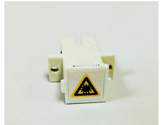
SC External Shuttered Adapters