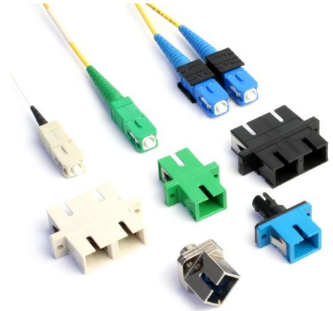
Multiple Options on SC Adapters