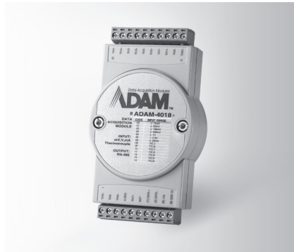
ADAM-4018+ FCC CE RoHS LISTED E190861 ETC.