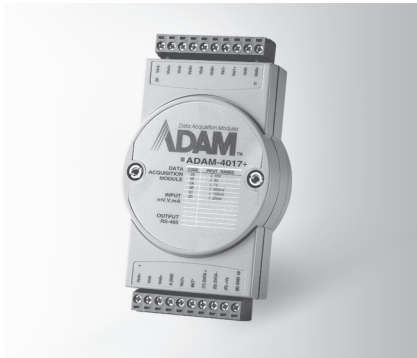
ADAM-4017+ FCC CE RoHS LISTED E190861 ETC.

8-ch Analog Input Module with Modbus 8-ch Thermocouple Input Module with Modbus 8-ch Universal Analog Input Module with Modbus