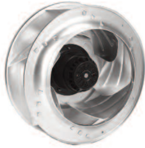
Duct Ring: DR400A (optional)