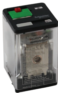
788 Full-Feature Cover