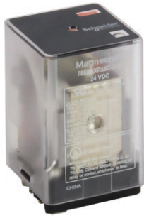
788 Clear Cover

UL listed when used with proper Magnecraft sockets