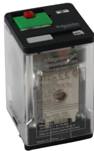
788 Full-Feature Cover