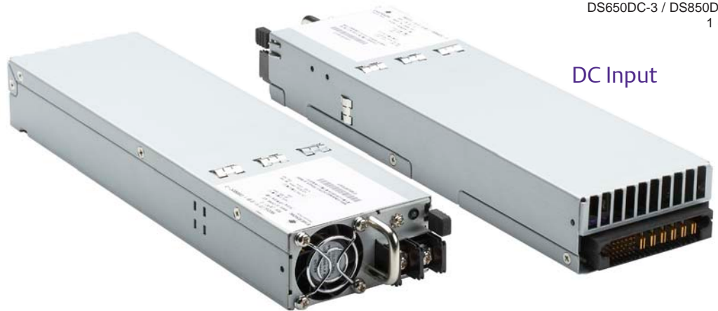
Connector input shown

Distributed Power Bulk Front-End Total Output Power: 650 - 850 Watts +3.3Vdc Stand-by Output Standard Telco input range -39 V to -72 VDC