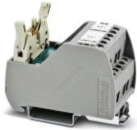
VARIOfACE Professional (VIP) board for the ROC800 controller

Please be informed that the data shown in this PDF Document is generated from our Online Catalog. Please find the complete data in the user's documentation. Our General Terms of Use for Downloads are valid ( http://phoenixcontact.com/download )