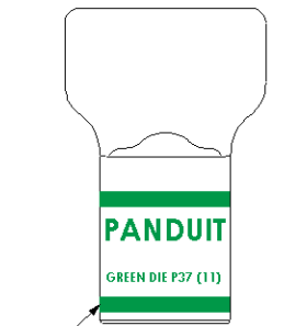
Color coded barrel markings