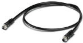
GOF MM cable, assembled with M12 OPTIC to M12 OPTIC

Assembled FO cable, round cable, 50/125 µm GOF-MM fiber, M12 to M12, for installation inside buildings