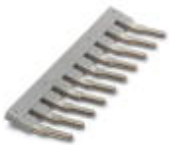
Insertion bridge, Number of positions: 10, Color: gray