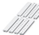
Zack marker strip, Strip, white, Unlabeled, Can be labeled with: Plotter, Mounting type: Snap into tall marker groove, For terminal block width: 8.2 mm, Lettering field: 10.5 x 8.15 mm

Zack marker strip - ZB 8:UNBEDRUCKT - 1052002