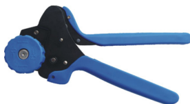
UTX Crimp Tool