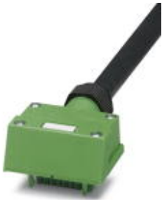
Sensor/actuator connector hood, with master cable, marking label, for an SAC box with 4 single-occupied slots

Please be informed that the data shown in this PDF Document is generated from our Online Catalog. Please find the complete data in the user's documentation. Our General Terms of Use for Downloads are valid ( http://download.phoenixcontact.com )