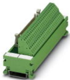
VARIOFACE module, with spring-cage connection and flat-ribbon cable connector, for mounting on NS 35/7.5, 16-pos.

Please be informed that the data shown in this PDF Document is generated from our Online Catalog. Please find the complete data in the user's documentation. Our General Terms of Use for Downloads are valid ( http://phoenixcontact.com/download )