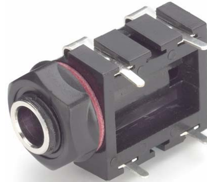
Model 7159 Horizontal 2-Conductor Jack, PC Board Mount