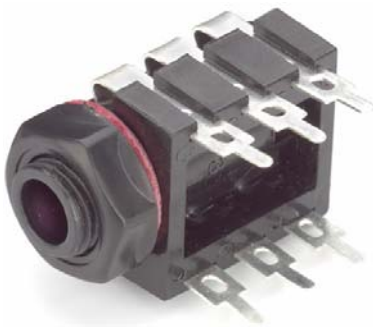
Model 7160 Horizontal 3-Conductor Jack, Solder Tabs