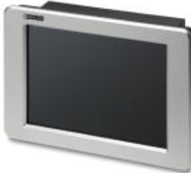
15-in. display shown

Please be informed that the data shown in this PDF Document is generated from our Online Catalog. Please find the complete data in the user's documentation. Our General Terms of Use for Downloads are valid ( http://download.phoenixcontact.com )