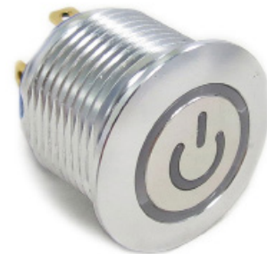
Part Number 2316366-1