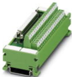
VARIOFACE module, with screw connection and D-subminiature socket strip, for assembly on NS 35/7.5, 37 positions

Please be informed that the data shown in this PDF Document is generated from our Online Catalog. Please find the complete data in the user's documentation. Our General Terms of Use for Downloads are valid ( http://phoenixcontact.com/download )