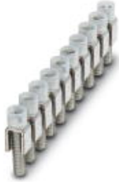
Fixed bridge, Number of positions: 10, Color: silver

Please be informed that the data shown in this PDF Document is generated from our Online Catalog. Please find the complete data in the user's documentation. Our General Terms of Use for Downloads are valid ( http://download.phoenixcontact.com )