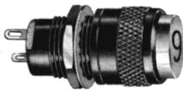
360-8430-0371-502 LH73/1; LC11RT2 Flat Lens