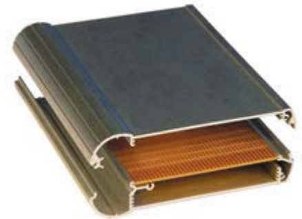
Example Application (Assembled View)