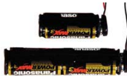
Cable Gland & Battery Kits