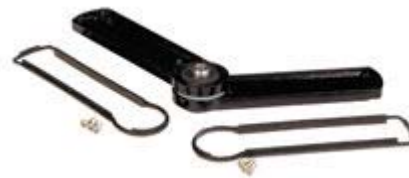
Variable Plate In Use