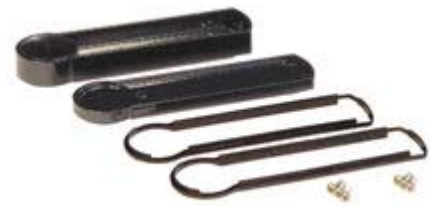
(click to enlarge) Collar Style