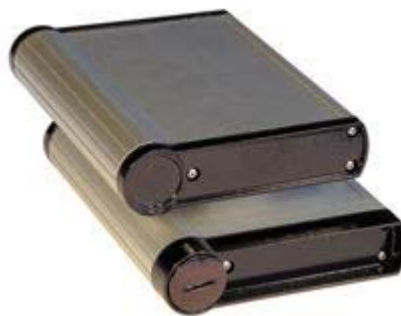
(click to enlarge) Flat Style (Top) Collar Style (Bottom)