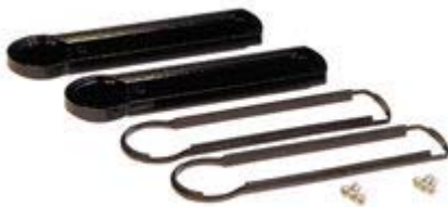
(click to enlarge) Flat Style