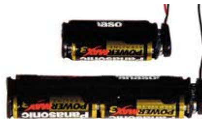
Cable Gland & Battery Kits