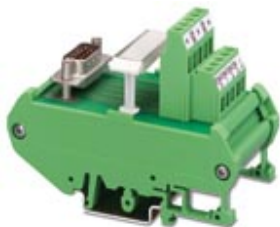
VARIOFACE interface module, for Siemens SIMATIC® S5-95U, alarm/counting inputs (to adapt a 9-position D-SUB pin strip to screw terminal blocks)

Please be informed that the data shown in this PDF Document is generated from our Online Catalog. Please find the complete data in the user's documentation. Our General Terms of Use for Downloads are valid ( http://phoenixcontact.com/download )