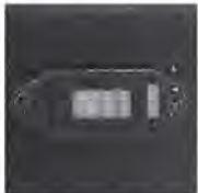
Dual Voltage Selector

ORION FANS fan trays are available in dozens of stock configurations. If you cannot find what you are looking for give us a call. We can design and build your trays from scratch or we can help you come up with solutions for your toughest problems.