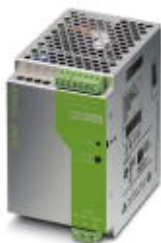
DIN rail power supply unit, primary-switched mode, 1-phase, output: 48 V DC / 5 A

Please be informed that the data shown in this PDF Document is generated from our Online Catalog. Please find the complete data in the user's documentation. Our General Terms of Use for Downloads are valid ( http://phoenixcontact.com/download )