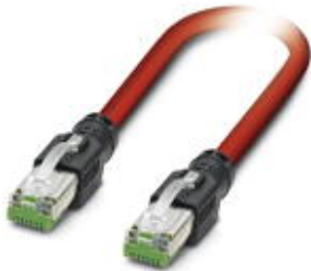
SERCOS III patch cable, shielded, star quad, AWG 22 stranded (7-wire), RAL 3020 (traffic red), RJ45 connector/IP 20, straight, to RJ45 connector/IP20, straight, length: 2.0 m

Please be informed that the data shown in this PDF Document is generated from our Online Catalog. Please find the complete data in the user's documentation. Our General Terms of Use for Downloads are valid ( http://download.phoenixcontact.com )