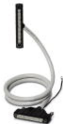
Assembled round cable with two molded 50-pos. socket strips (1:1 connection). Cable length: 11.0 m

Please be informed that the data shown in this PDF Document is generated from our Online Catalog. Please find the complete data in the user's documentation. Our General Terms of Use for Downloads are valid ( http://phoenixcontact.com/download )