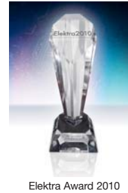
Elektra Award 2010