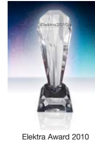
Elektra Award 2010