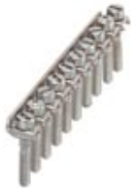
Fixed bridge, Number of positions: 10, Color: silver

Please be informed that the data shown in this PDF Document is generated from our Online Catalog. Please find the complete data in the user's documentation. Our General Terms of Use for Downloads are valid ( http://download.phoenixcontact.com )