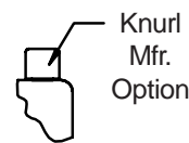
Sym. A Socket Head