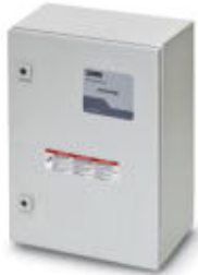
Combination lightning arrester and TVSS system for ungrounded 480 V Delta systems

Please be informed that the data shown in this PDF Document is generated from our Online Catalog. Please find the complete data in the user's documentation. Our General Terms of Use for Downloads are valid ( http://phoenixcontact.com/download )