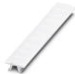
Zack marker strip, Strip, white, Labeled according to customer specifications, Mounting type: Snap into tall marker groove, For terminal block width: 6.2 mm, Lettering field: 6.15 x 10.5 mm