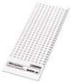
Marker cards, Card, white, Unlabeled, Can be labeled with: Plotter, Mounting type: Snap into tall marker groove, Snap into flat marker groove, For terminal block width: 6.2 mm, Lettering field: 6 x 6.1 mm

Marker cards - SBS 6:UNBEDRUCKT - 1007222