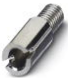
Female test connector, Color: silver

Female test connector - PSB 3/10/4 - 0601292