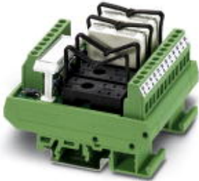
VARIOFACE module, for 4 plug-in miniature relays or miniature optocouplers, with LED, 230 V AC input voltage

Please be informed that the data shown in this PDF Document is generated from our Online Catalog. Please find the complete data in the user's documentation. Our General Terms of Use for Downloads are valid ( http://phoenixcontact.com/download )