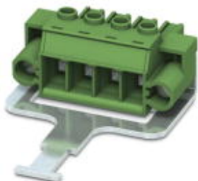
PCB connector, nominal current: 41 A, number of positions: 6, pitch: 7.62 mm, connection method: Screw connection with tension sleeve, color: black, contact surface: Tin

Please be informed that the data shown in this PDF Document is generated from our Online Catalog. Please find the complete data in the user's documentation. Our General Terms of Use for Downloads are valid ( http://phoenixcontact.com/download )