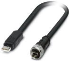
Assembled USB cable, shielded, color: black, PVC outer sheath, USB mini-B/IP20 on USB type A/IP20, length: 5 m

Please be informed that the data shown in this PDF Document is generated from our Online Catalog. Please find the complete data in the user's documentation. Our General Terms of Use for Downloads are valid ( http://download.phoenixcontact.com )