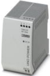
Primary-switched UNO power supply for DIN rail mounting, input: single-phase, output: 48 V DC/100 W

Please be informed that the data shown in this PDF Document is generated from our Online Catalog. Please find the complete data in the user's documentation. Our General Terms of Use for Downloads are valid ( http://phoenixcontact.com/download )