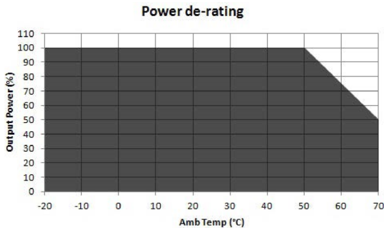
Figure 1. Derating Curve

De-rate linearly from 100% at 50°C to 50% at 70°C