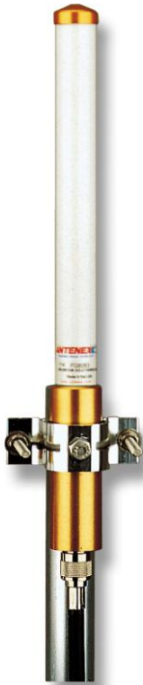
FG8240 (Shown with optional FM2SP mounting kit)